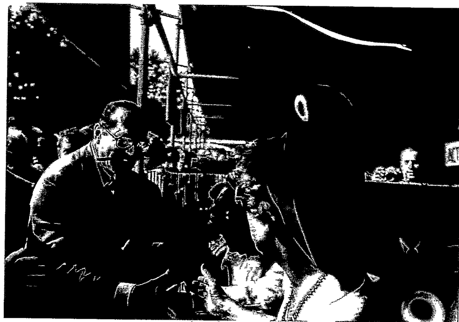
JACQUES CHIRAC , en décembre 1976, orne le logo de son parti, le RPR, du bonnet phrygien. "Il n'est pas un symbole de paix mais d'ordre républicain", explique l'historien Loris Chavanette. Ci-dessus, le maire de Paris, à Salon-de-Provence, en juillet 1978.

Idem place de la Nation, où le Triomphe de la République , statue de Jules Dalou, est installé dans la perspective du centenaire de la Révolution. La version provisoire de l'œuvre, en plâtre peint, est inaugurée le 21 septembre 1889 – jour anniversaire de l'abolition de la royauté en 1792 – en présence du président Sadi Carnot. La version définitive, en bronze, la remplacera dix ans plus tard, en 1899. Autre date clé de cette entrée du bonnet phrygien dans la symbolique officielle de la République française, l'année 1895, qui voit la mise en circulation de pièces avec la figure