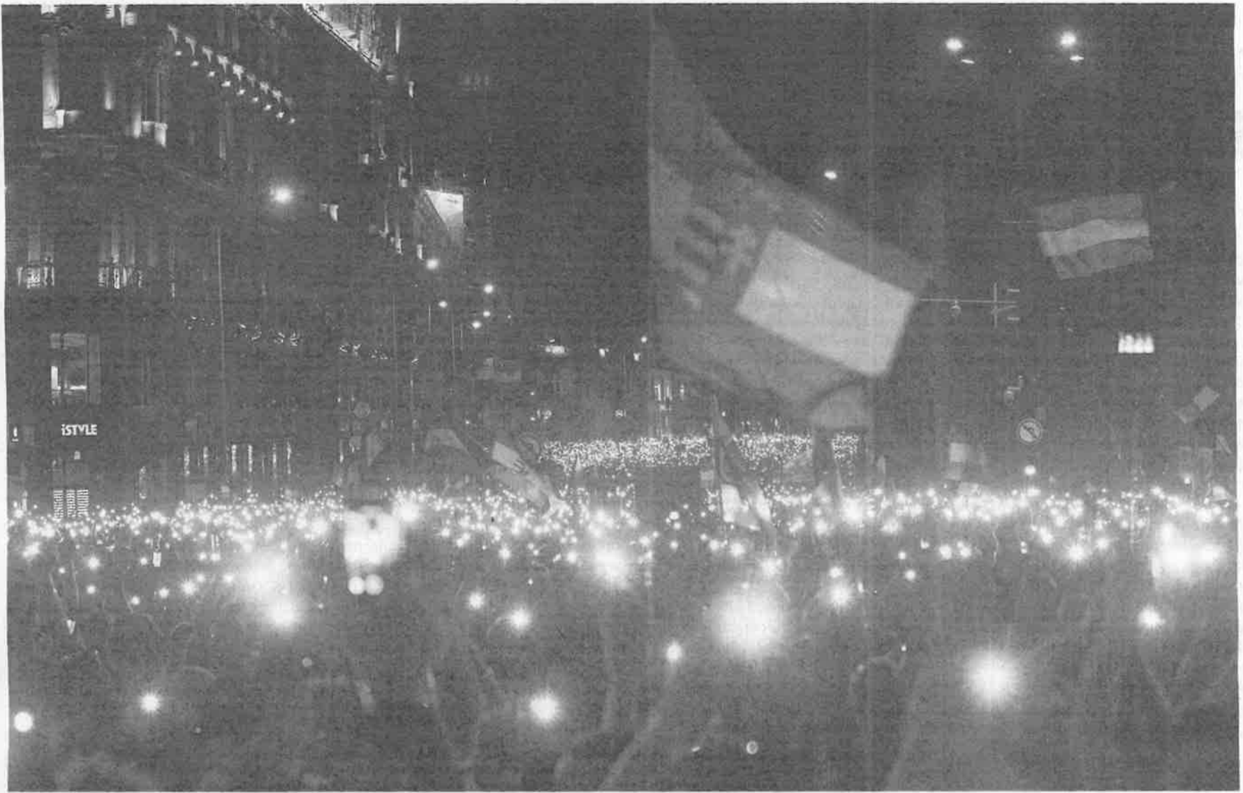
Manifestation contre le président hongrois Viktor Orban, à Budapest, le 21 avril.

cratie reste une démocratie tant que le gouvernement ne bourre pas les urnes le jour des élections, il faut reconnaître que [dans ces régimes] la démocratie elle-même est abîmée», explique, dans le New York Times du 5 avril, l'auteur de Qu'est-ce que le populisme? Définir enfin la menace (Premier Parallèle, 2016).