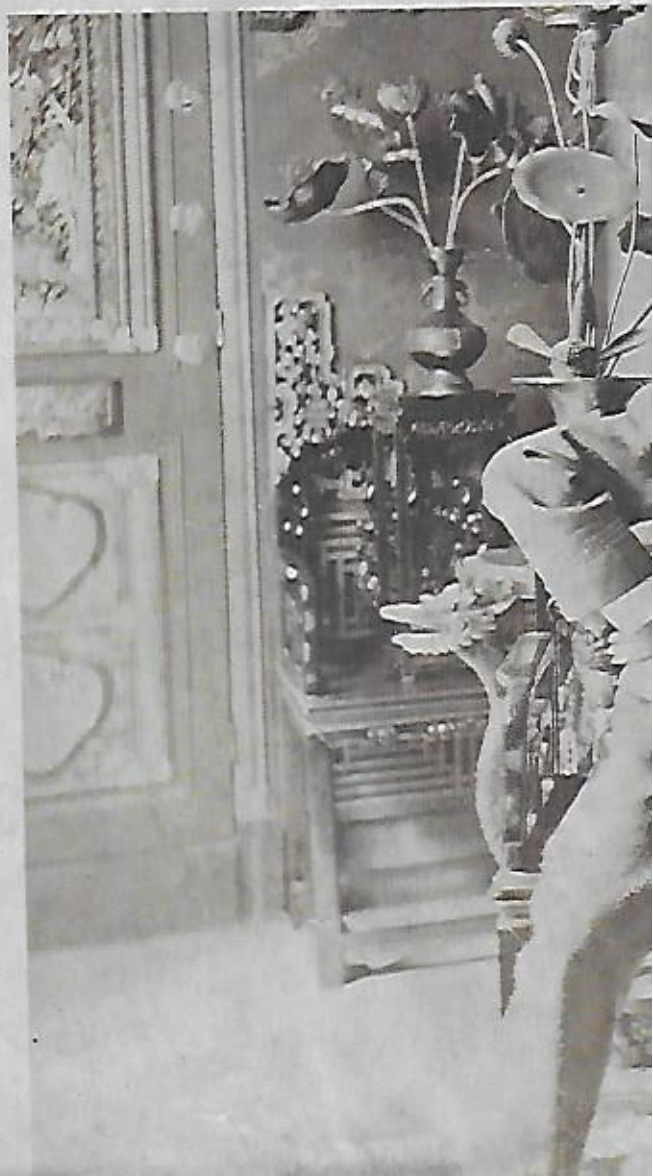
L'écrivain Pierre Loti, dans sa maison de Rochefort, vers 1892.